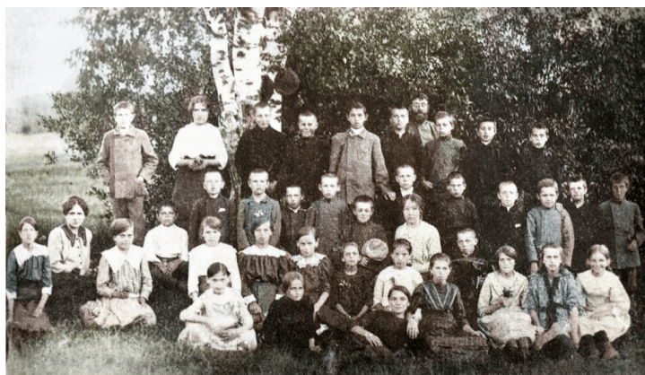
Первый выпуск Красной школы